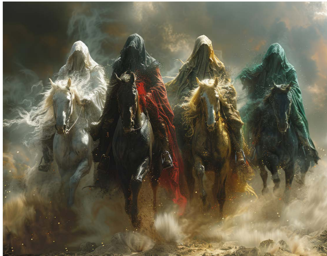
Die vier apokalyptischen Reiter

In einer Gesellschaft, die Leistung, Selbstoptimierung und Perfektion glorifiziert, wird das Dunkle ins Unbewusste verbannt. Das führt zu psychischer Spal-